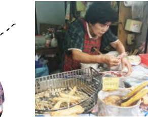
淡水名物の絶品エビ春巻